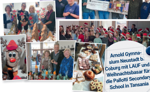
Arnold Gymna- sium Neustadt b. Coburg mit LAUF und Weihnachtsbasar für die Pallotti Secondary School in Tansania