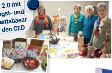
Werk- AG 2.0 mit Pfingst- und Adventsbasar für den CED