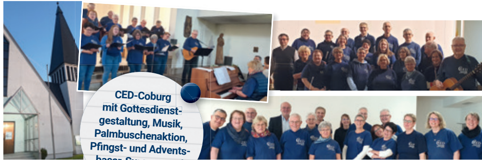
CED-Coburg mit Gottesdienst- gestaltung, Musik, Palmbuschenaktion, Pfingst- und Advents- basar, Suppen- und Kuchenessen