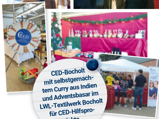
CED-Bocholt mit selbstgemachtem Curry aus Indien und Adventsbasar im LWL-Textilwerk Bocholt für CED-Hilfsprojekte