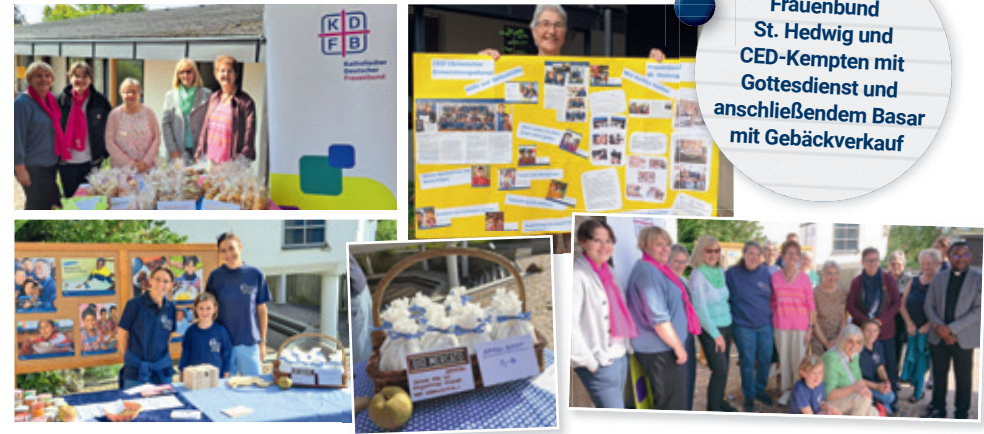
Kath. Frauenbund St. Hedwig und CED-Kempten mit Gottesdienst und anschließendem Basar mit Gebäckverkauf