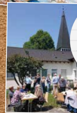
Pfingsten Festgottesdienst in St. Marien mit anschließendem Weißwurstessen im Pfarrheim