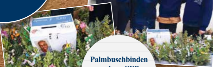
Palmbuschbinden und conCED Gottesdienst-Gestaltungen