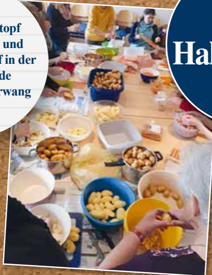
Aktionen „Eintopf statt Schnitzel“ und Weltladenverkauf in der Pfarrgemeinde Haldenwang/Börwang