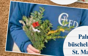
Palmbüschelaktion St. Marien Coburg