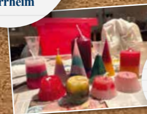
Heilos Kerzenaktion in Coburg