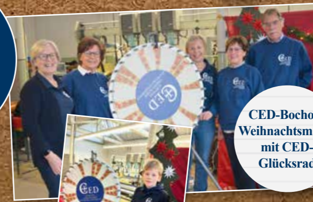
CED-Bocholt: Weihnachtsmarkt mit CED-Glücksrad