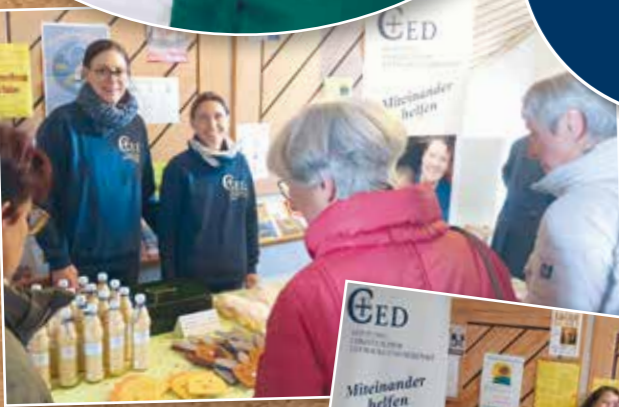
CED-Basar bei der Fastenaktion in St. Hedwig, Kempton