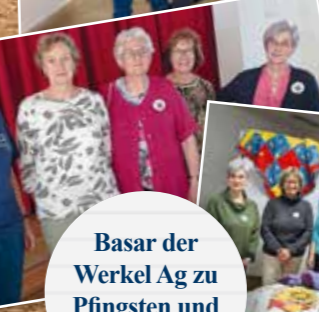
Basar der Werkel Ag zu Pfingsten und Advent