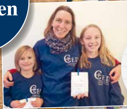
CED-Basar in der Fastenzeit und im Advent mit „Kleiner Auszeit in der Tüte“ beim Konzert der Thingsers Gospel Singers