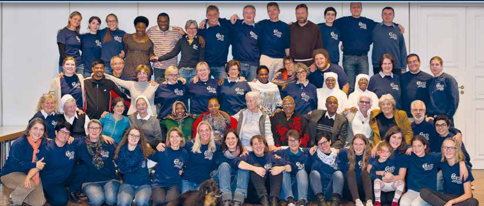
Dieses Bild wurde 2017 vor der Coronakrise beim 25. Jubiläum des CED aufgenommen. Es zeigt den Zusammenhalt von CED-Helfern und internationalen Projektpartnern. Dieser gute Zusammenhalt zeigt sich vor allem jetzt, in der erschwerten Pandemiezeit durch eine effiziente und vertrauensvolle Zusammenarbeit für Menschen in Not.